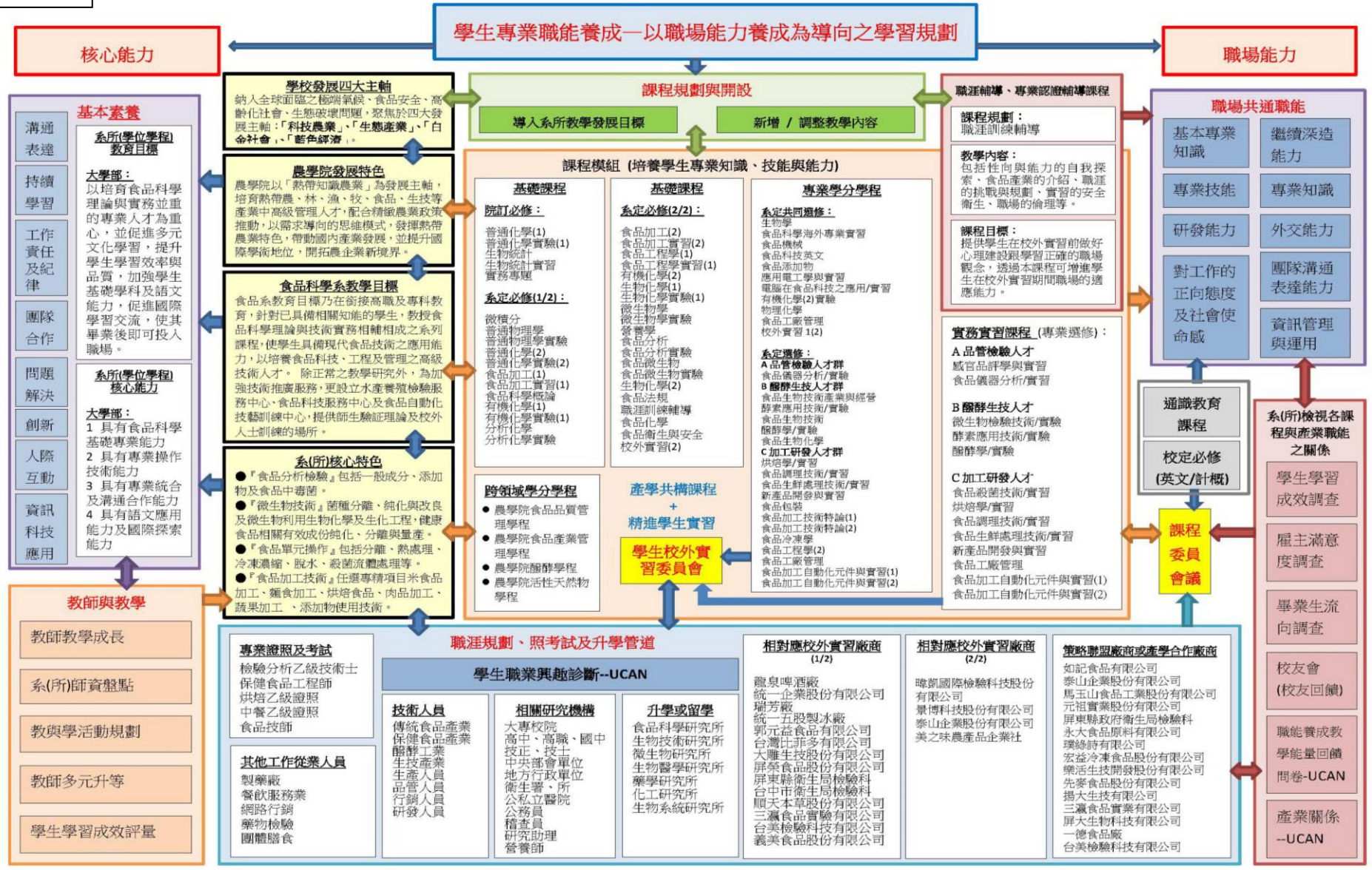
各教學單位特色核心指標、教育目標、核心能力、課程地圖及就業地圖(職涯進路)彙整圖 (以食品科學系為例)