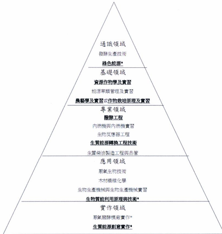
生質能源學程架構圖